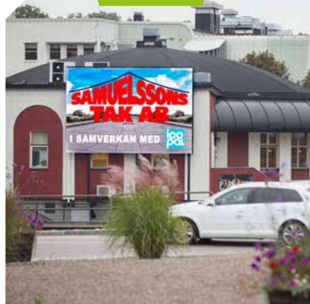
27 m 2 skärm

VIRIBA LEVERERAR NYCKELFÄRDIGA lösningar där allt från skyltbärare, fundament, installation och elförsörjning ingår. Men den enskilde kunden kan naturligtvis stå för allt förarbete medan Viriba bara ser till att själva installationen utförs med största möjliga kvalitet.