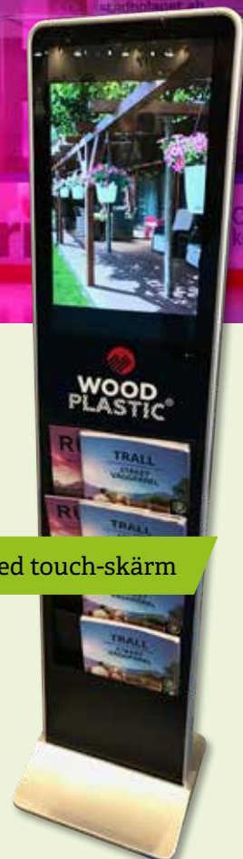
Även med touch-skärm

IBLAND HAR BROSCHYRSTÄLL en tendens att se ganska tråkiga ut. Men så behöver det inte vara. Det digitala broschyrstället innebär att det är möjligt att marknadsföra broschyren med hjälp av dess innehåll. Det digitala broschyrstället har en skärm som är mellan 21 och 72 tum. Finns både med och utan touch-skärm.