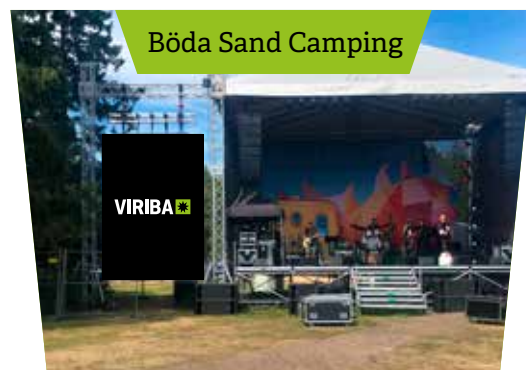
Böda Sand Camping

OAVSETT OM DET handlar om köp, leasing eller kortare hyrperioder levererar Viriba alltid bästa möjliga tekniska lösning för den enskilde kunden. Komponenterna i de digitala reklamskärmarna väljs ut från 100-talet leverantörer över hela världen. Allt för att matcha högt ställda krav på ljusstyrka, hållbarhet och driftsäkerhet.